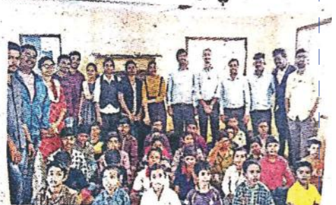
అనాథాశ్రమ చిన్నారులతో అరోరా విద్యార్థులు అరోరా

హబ్బిగూడ, న్యూస్ టుడే: మానవ వనరుల అభివృద్ధి మంత్రిత్వ శాఖ మార్గదర్శకాలతో