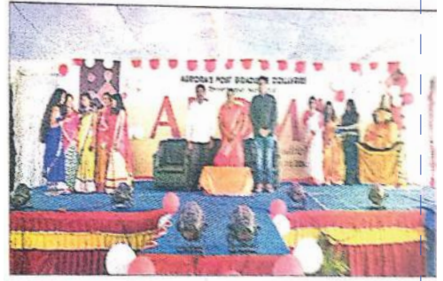
కార్యక్రమాన్ని ప్రారంభిస్తున్న ప్రతినిధులు