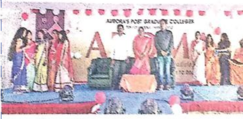
వేడుకల్లో విద్యార్థులు, నిర్వాహకులు