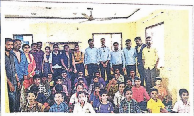
అనాథ బాలలకు నిత్యావసర వస్తువులు అందజేసిన రామంతాపూర్ ఆరోరా కళాశాల పీజీ విద్యార్థులు